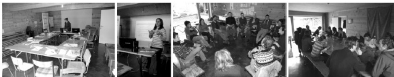
Théorie: droit à l'alimentation / accès à la terre / accaparement / et la Belgique? Repas à la ferme