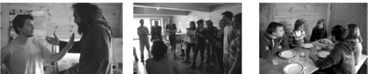
Théâtre action Action non violente et mobilisation Débats - Film