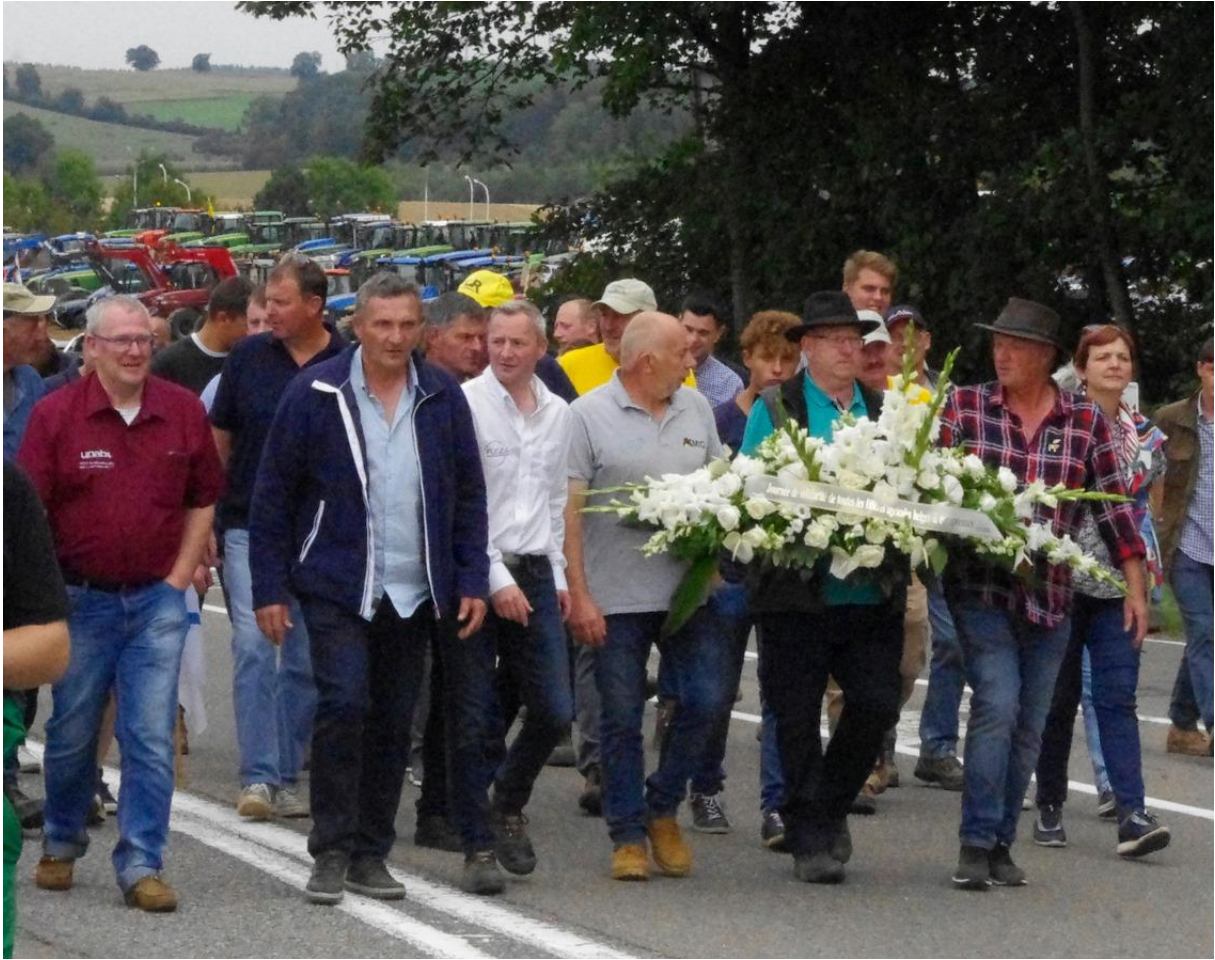
Figure 7. Dépôt d'une gerbe de fleurs dans le cadre de la manifestation du 16 septembre 2019.