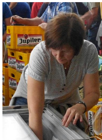
Figure 4. Les femmes en charge du catering lors de la manifestation.