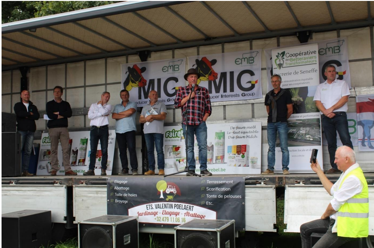
Figure 5. Les représentants des syndicats sur le podium pour exprimer les revendications politiques.

Dans la plupart des manifestations, des représentant·e·s prennent la parole pour rappeler les revendications du secteur. Sur la grosse dizaine d'interventions, seule une femme s'est exprimée sur le podium.