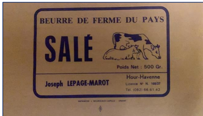
Figure 1. Illustration de l'invisibilité du travail de transformation de l'agricultrice sur un emballage de beurre.

forte négation du travail des épouses réalisé à titre gratuit (Barthez, 2005, p. 1) (voir figure 1). Le terme « agricultrice » n'est d'ailleurs rentré dans le Petit Larousse qu'en 1961.