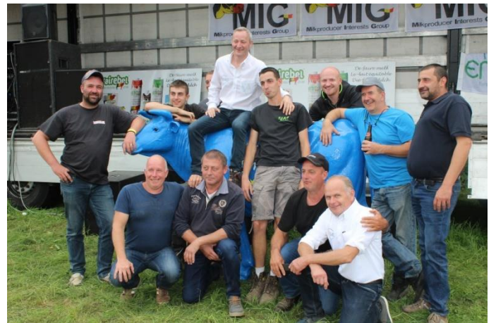
Figure 3. La foule présente lors de la manifestation du 16 septembre 2020.