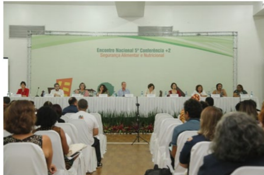
Encontro Nacional Segurança Alimentar e Nutricional (Brasília, maart 2018)

Dit beleid werd mogelijk gemaakt door een wet die in 2006 het 'Nationale Systeem voor Voedselzekerheid' oprichtte (SISAN - Sistema Nacional de Segurança Alimentar e Nutricional), dat bestaat uit een interministerieel orgaan (CAISAN) van meer dan 20 verschillende ministeries, en een nationale raad voor voedselzekerheid (CONSEA), met 2/3 organisaties uit het middenveld en 1/3 overheidspersoneel. Om de vier jaar organiseert CONSEA een conferentie die aanbevelingen doet voor het beleid. CAISAN schrijft dan het beleidsplan op basis van deze aanbevelingen. Zo kunnen organisaties van het middenveld een belangrijke sturing geven aan dit beleid. FIAN Brasil is ook een actief lid van CONSEA. Verder werd het recht op voedsel sinds 2010 in de Braziliaanse grondwet opgenomen.