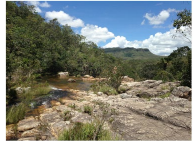
Waterval in de Cerrado, Chapada dos Veadeiros

"Wij, de verdedigers van het mensenrecht op voedsel, zijn