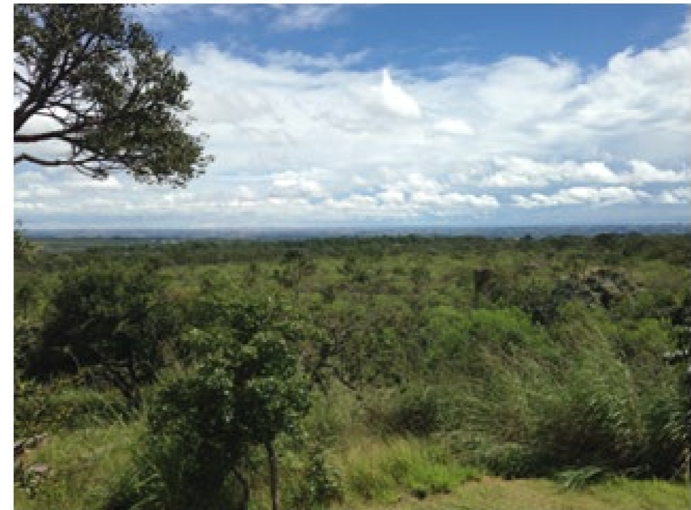
De Cerrado (Botanische tuin in Brasília)

"Nós, defensoras e defensores do DHAA, estamos firmes, fortes e resilientes e não vamos nos render. Estamos presentes nas cidades, nos campos, nas florestas e nas águas, ocupando espaços institucionais e não institucionais e mobilizando a sociedade em prol da agenda de SAN e pela realização de direitos."