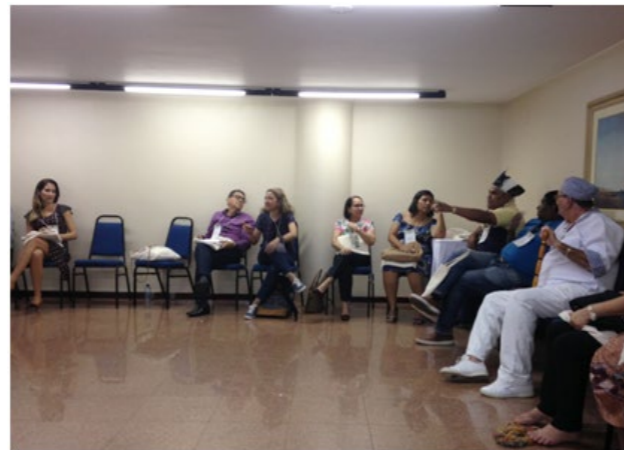
Encontro Nacional Segurança Alimentar e Nutricional (Brasília, maart 2018) - werkgroep

Begin maart van dit jaar kon ik als enige buitenlandse gast een conferentie van CONSEA bijwonen in Brasília. Zo'n 350 deelnemers kwamen vanuit heel Brazilië, waaronder leden van inheemse gemeenschappen en andere minderheden. Het was hartverwarmend om te zien hoe de Brazilianen gepassioneerd streden voor essentiële programma's om honger en ondervoeding tegen te gaan. Tegelijk was het ook ontmoedigend: de bezuinigingen van president Temer zorg-